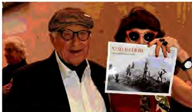
Il film di Elisabetta Sgarbi su Migliori è stato premiato ai Nastri d'Argento nella cinquina dei documentari che raccontano protagonisti ed eventi di cinema e cultura

matografici Italiani - dice Elisabetta Sgarbi - Sono contenta di aver sintetizzato il lavoro di una vita di uno dei più importanti fotografi del '900 e di questo primo quarto del nuovo millennio in 42 minuti, come i 42 giorni di de Maistre nel 'Viaggio intorno alla mia stanza', e così si chiama il film «Nino Migliori. Viaggio intorno alla mia stanza». È la storia di un film mio e non mio. È un film su Nino Migliori che, sin da subito, sfugge di mano, e diventa un film di Nino Migliori». Nino Migliori, tra i più autorevoli e multiformi ricercatori italiani nel campo della fotografia si racconta, ripercorre la sua vita artistica, personale, imprese e sperimentazioni, artista che la Sgarbi ha anche ospitato in mostra alla Milanese 2022. Il film si avvale della complicità di Mari-